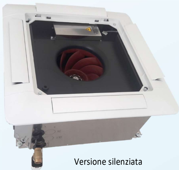
Versione silenziosa Silenced version