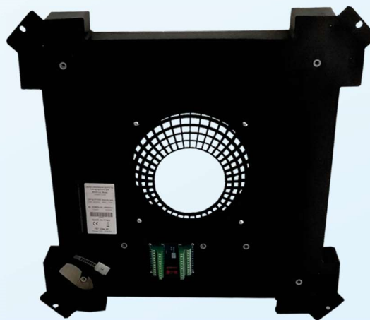
Accessorio flowgrid installato Installed flowgrid accessory

Le unità idroniche a cassetta PS-CLES rappresentano la vera essenza del comfort. Sono state studiate e progettate appositamente per rispondere alle molteplici richieste di riduzione delle emissioni sonore in diversi ambienti quali ospedali, hotel, biblioteche dove la massima silenziosità è una prerogativa. Con il loro moderno design, la flessibilità di regolazione e la semplicità di manutenzione rappresentano il risultato di accurate analisi per l'ottenimento di un articolo innovativo, adattabile a qualsiasi ambiente ed arredamento e che risponde alle esigenze di massima silenziosità, ottenuta grazie all'installazione di un motore speciale a basso numero di giri. Le dimensioni dell'unità si adattano perfettamente alla modularità dei pannelli per controsoffitti. Disponibili in due grandezze 600x600 mm (PS050- PS094) e 1200x600 mm (PS100-154) nella sola versione con motori EC. Inoltre per ridurre ulteriormente i livelli di emissioni sonore proponiamo come accessorio una "flow grid" la cui installazione nella cassetta permette di abbassare ulteriormente il livello di rumorosità di 2 dB(A), nel funzionamento dell'unità alle velocità più alte.